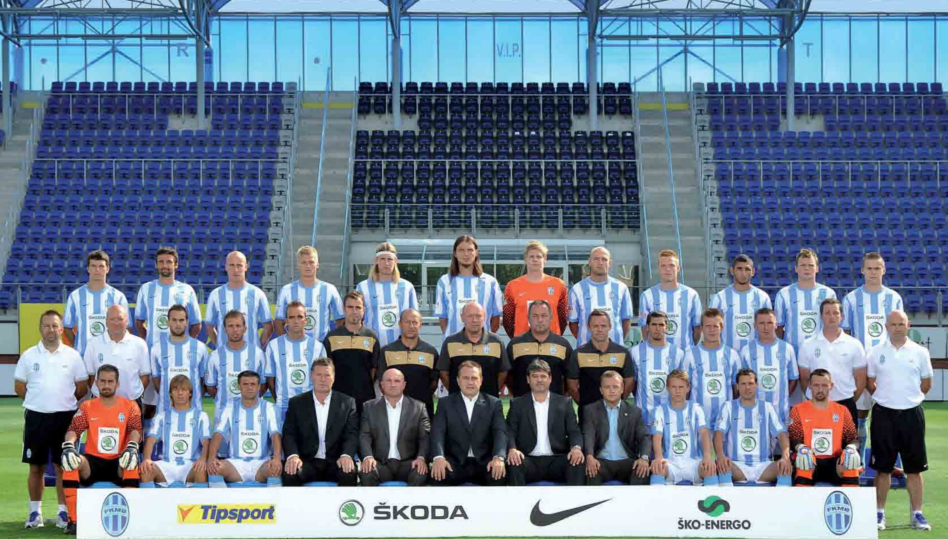
FK Mladá Boleslav Gambrinus liga 2011/2012