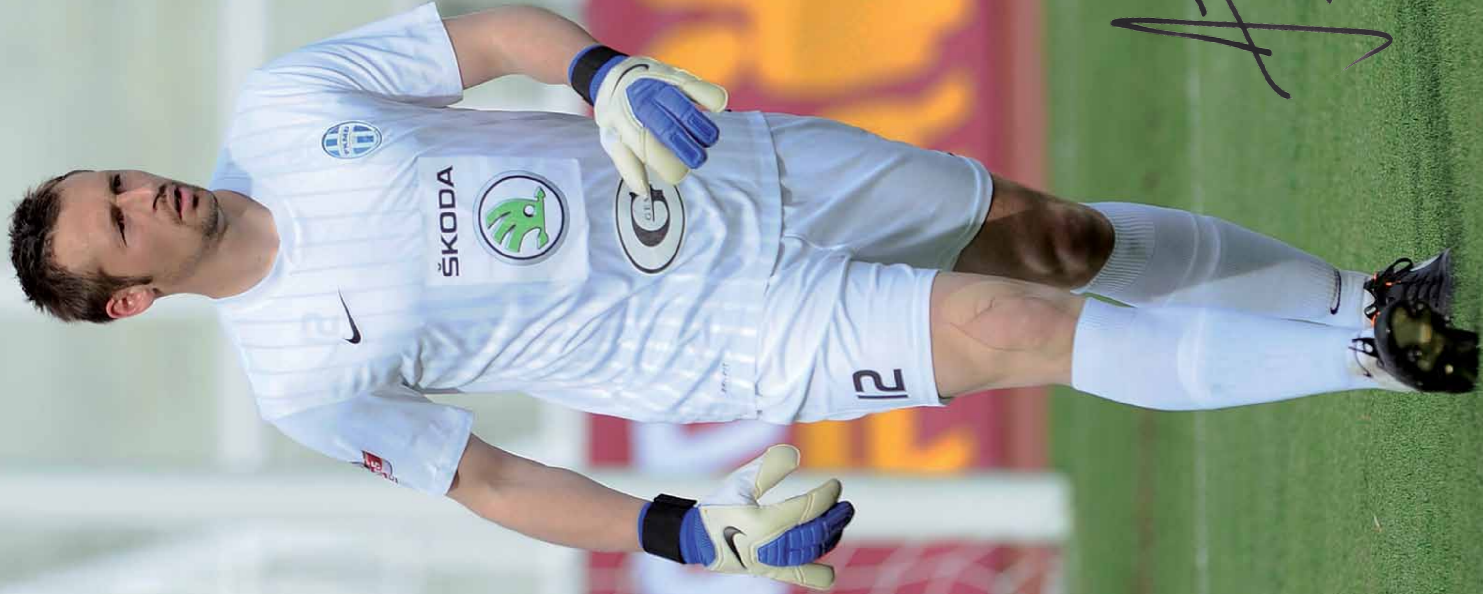
FK Mladá Boleslav